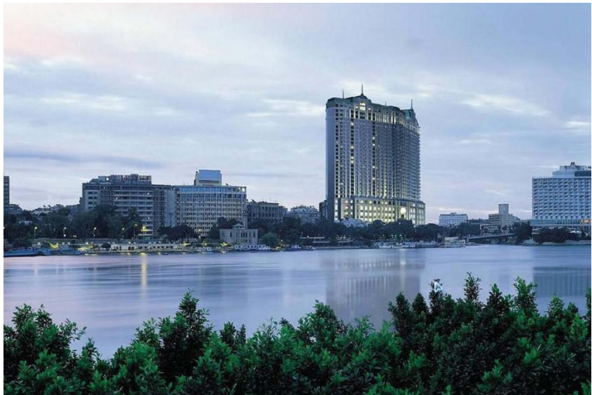
标志性建筑——开罗四季酒店

【首都简介】埃及首都开罗位于尼罗河三角洲顶点以南14公里处，北距地中海200公里，是埃及的政治、经济、商业和文化中心。开罗省、吉萨省、盖勒尤比省共同组成的大开罗区，人口超过2500万，是阿拉伯和非洲国家人口最多的城市，是世界第十六大都会区。古埃及人称开罗为“城市之母”，阿拉伯人把开罗称作“卡海勒”，意为征服者或胜利者。