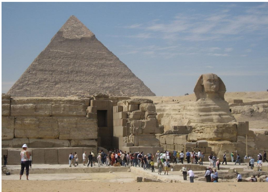
金字塔和狮身人面像

1922年2月28日，英国宣布埃及为独立国家，但保留对其国防、外交、少数民族等问题的处置权。1952年7月23日，以纳赛尔为首的自由军官组织推翻法鲁克王朝，成立革命指导委员会，掌握国家政权。1953年6月18日，宣布成立埃及共和国。