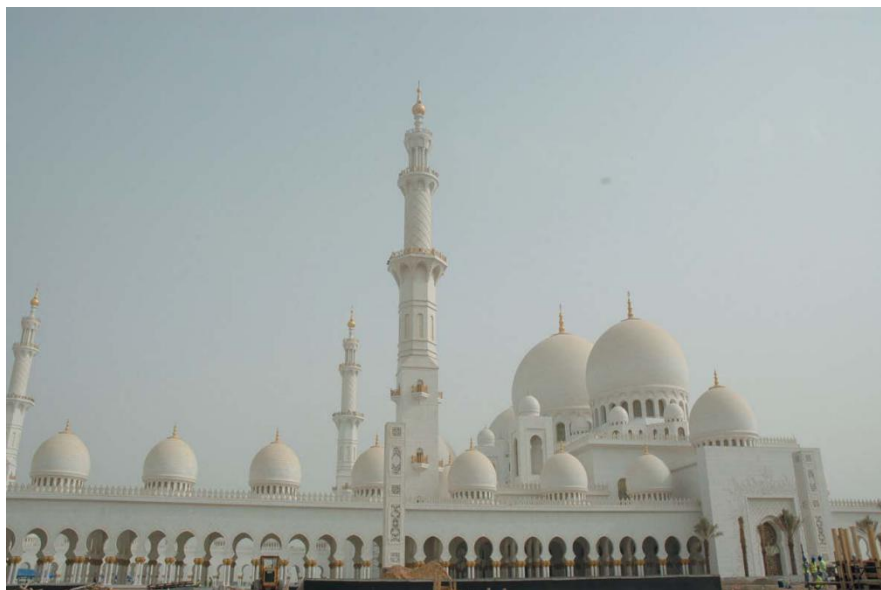
谢赫扎耶德清真寺