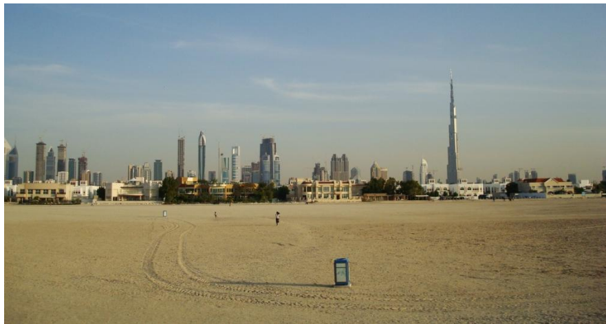
迪拜中央商务区远眺

世界经济论坛《2019年全球竞争力报告》显示，阿联酋在全球最具竞争力的141个国家和地区中，排第25位。