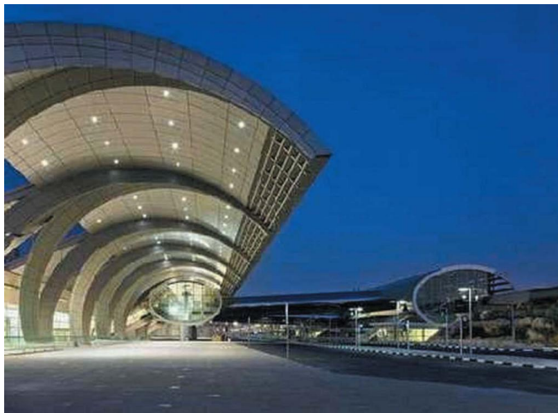
迪拜国际机场T3航站楼外景