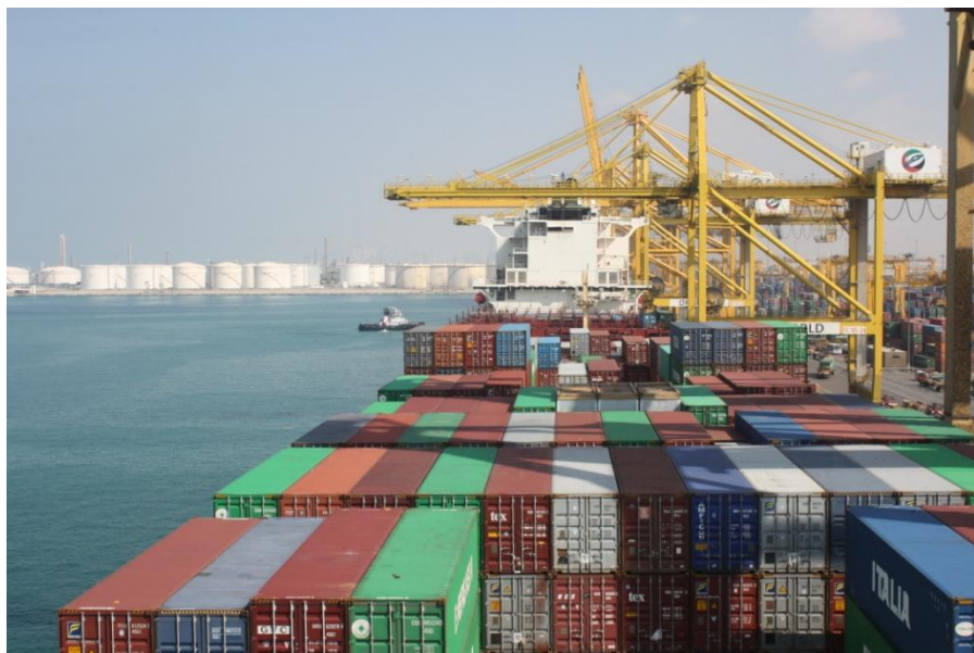
杰贝阿里集装箱码头

哈利法港，为阿布扎比最大的商业港口，目前一期已完工。项目第一阶段包括具有年处理200万20英尺标准箱能力的港口和面积51平方公里的工业区A区。哈利法港已取代扎耶德港成为阿布扎比的主要货运港。目前，哈利法港口吞吐量为250万标箱和1200万吨一般货物。中远海运码头公司于2016年9月获得二期码头35年特许经营权。2018年12月10日，中远海运港口阿布扎比码头正式开港。2019年5月，中远太阳轮和双鱼座轮两艘可载两万标箱以上的超大巨轮相继停靠中远海运阿布扎比码头。